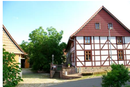
Seminar- und Ferienhof Iber

TERMIN 25./26.09.2021 ZEITEN SA 25.09. 10- 19 UHR SO 26.09. 10-14 UHR INKL. PAUSEN ORT SEMINARHOF IBER (ZWISCHEN MORINGEN UND EINBECK)